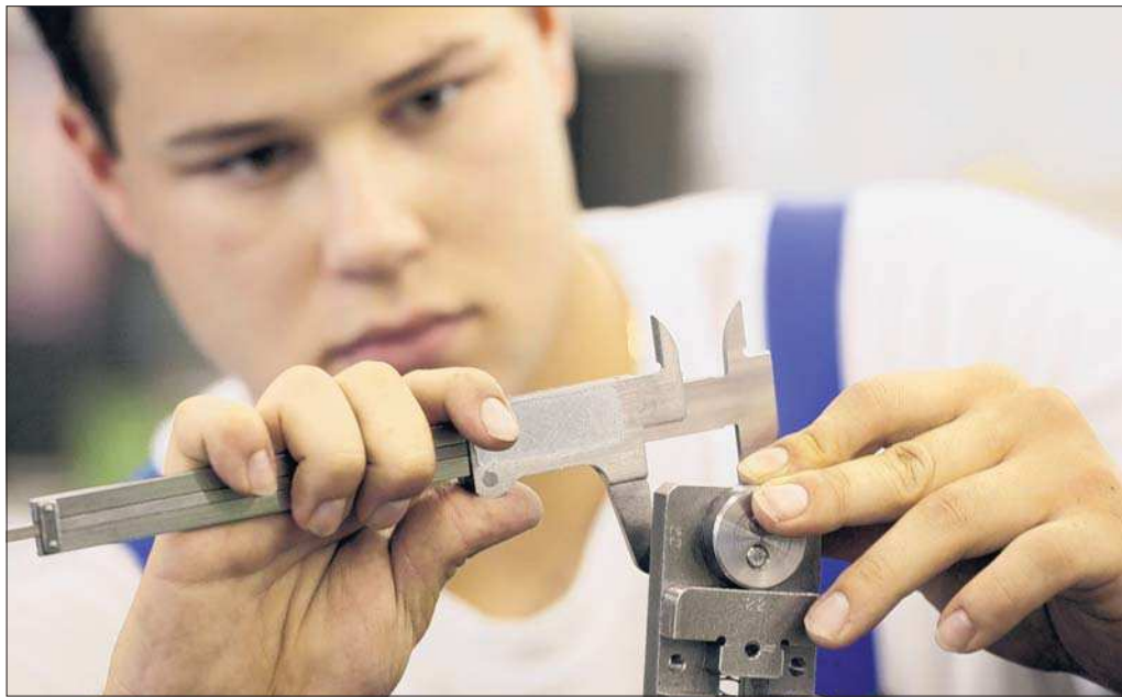
Handwerk hat goldenen Boden: Diese Weisheit trifft derzeit für die meisten Betriebe nicht zu – die Umsätze sinken.

Unter der Krise leiden besonders die Handwerker, die stark von gewerblichen Kunden abhängig sind – also Metallbauer oder Feinwerkmechaniker. Hier sanken die Erlöse um 17,7 Prozent, zugleich bauten die Firmen 3,3 Prozent ihrer Belegschaft ab. Besser lief es dagegen bei den Handwerkern, die sich mit ihren Diensten an Privatkunden richten, wie Friseure oder Steinmetze, die stabile